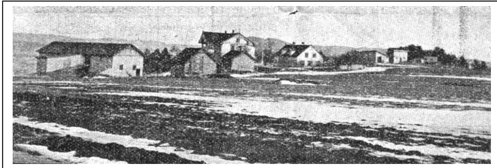
Lille Ekeberg ca. 1911, i midten begge våningshus

Lille Ekeberg ble regulert til bebyggelse i 1946 og det ble bygget Svenskehus og boligblokker på Lille Ekeberg fra 1947 og utover.