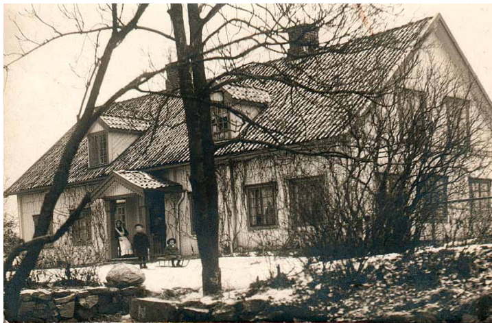
Våningshuset på Lille Ekeberg

Redigert utdrag av en artikkel av Gerd Woll.