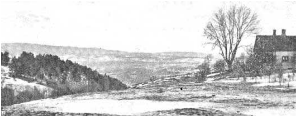
Simensbråten i 1911, det store treet og huset til høyre er ved selve gårdstunet.

Simensbråten kaller vi området mellom Ryen og Ekebergsletta. Og til Ryen må vi for å finne historiens begynnelse, for Simensbråten gård lå tidligere under Ryen gård (g. nr. 149). Søndre og Nordre Ryen tilhørte Oslo Bispestol og Sikeland præbende før det ble krongods på 1600-tallet. I 1687 ble gården kalt Ryen prestegård etter at slottspresten i ca. 60 år hadde hatt ansvaret for gården. Den tilhørte Oslo Hospital rundt 1800.