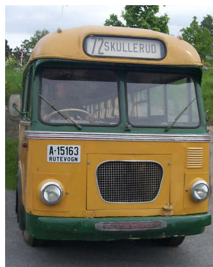
Ekebergbanebuss t.v. og Skullerudbuss t.h. fra 1950 tallet

I 1930 var Nordstrandsruten nr 5 blant de største bussrutene i Oslo og omegn. Det ble totalt befordret 847 806 passasjerer det året. Til sammenlikning hadde Ekebergbanen 296 395 passasjerer på ruten til Skullerud og 197 996 passasjerer på ruten til Simensbråten. Det var ikke bare lett for Skullerudbussen heller, den ble slått konkurs etter at de hadde problemer med å betale for innkjøp av nye busser. Etter litt frem og tilbake kom de i gang igjen. Senere ble ruten lagt om og gikk via Kverner til Ryenbergveien og over Brattlikollen til Steingrimsvei, Oberst Rodes vei og så til Skullerud. De kjørte så denne samme veien tilbake. Ekstrabussene ble ofte kjørt kun til Bakkerudveien eller Raschs vei (Karlsrud).