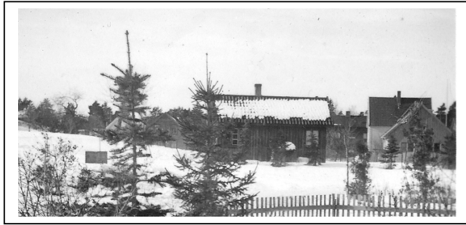
Kolsrud i 1950, huset til høyre ligger fortsatt ut mot Raschs vei.