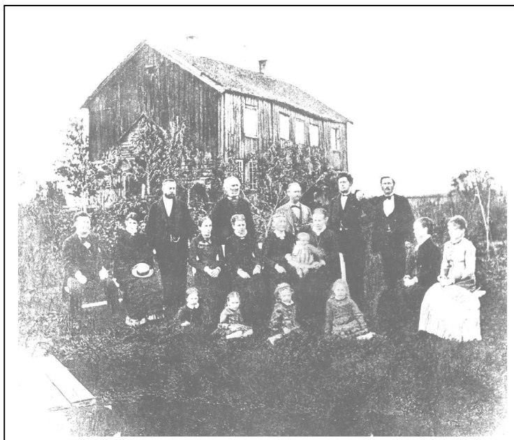
Familiesamling på Ekeberg hovedgård for over 100 år siden. I forgrunnen skimtes dammen.