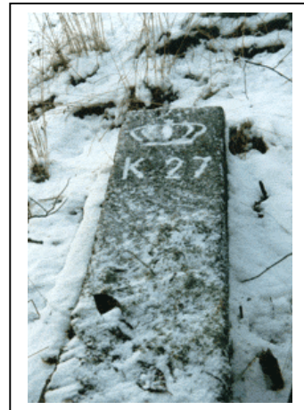
Stein nr. 27 veltet

Fine gamle grensesteiner fra en svunnen tid da Bekkelagshøgda lå utenfor Oslo (Kristiania). I den gamle Byskogen finnes det rester etter den gamle grensen mellom Kristiania by og Aker herred. Etter byutvidelsen i 1878 ble det satt opp en rad grensesteiner for å markere grensen. I området nedenfor Kafé Utsikten i Kongsveien kan man fortsatt finne noen av disse. Bekkelagshøgda lokalhistoriske forening har kartlagt disse steinene og avfotografert de som fortsatt står. Noen av steinene er helt borte mens andre er i mer eller mindre god stand. På steinene ser vi kronen og K inngravert. På baksiden er symbolet A for Aker og samme nummer som på forsiden. Steinene står ofte i meget bratt terreng, så man bør ha gode sko og klatreferdigheter. Stein nr 1 ble fjernet når man bygget Mosseveien. Stein nr 2 er rett over nedkjørselen til Sjursøya. De andre steinene følger bortover fjellsiden og bort til gjerdet ved eiendommene i Karlsborgveien, videre ved oppkjørselen til "Ekebergrestauranten" og denne kan man lett gå til uten klatring. Stein nr 12 er i kjelleren på ekebergrestauranten. Steinene fortsetter bortover skråningen mot Arctanderbyen og noen av eiendommene i Brannfjellveien. Så ovenfor Simensbrekka og ved Oslo Panorama er stein nr 27, som BLF nå skal gjøre mer tilgjengelig på plenen ved Ryenbergveien 73 a. I alt var det 81 steiner i en ring rundt byen. Den siste var ved Frognerkilen.