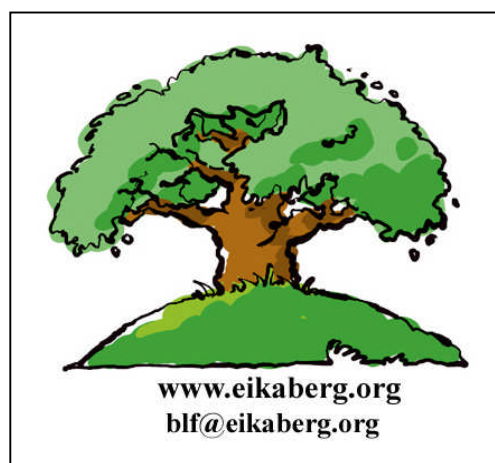
Logo for hjemmeside med ny e-postadresse