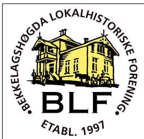
BLFs nye logo

BLF mottar gjerne gaver og sponing fra firma eller privatpersoner som vil støtte vårt lokalhistoriske arbeid. Ta kontakt.