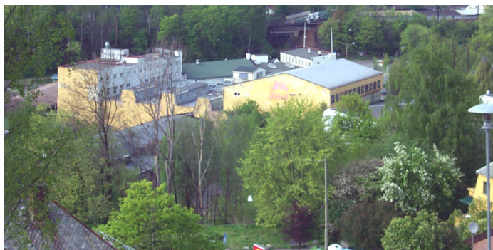
Foto til høyre: Dagens bygninger hvor den falmede Jøtul logo er på sydveggen.