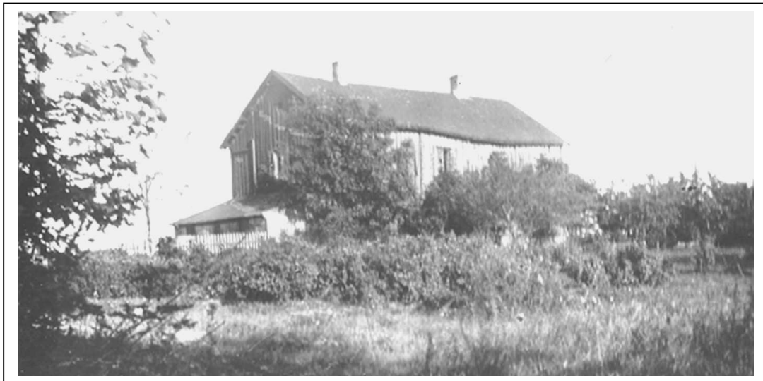
Ekeberg hovedgård er et av tre stamhus i Norge. Det ble stamhus i 1781. Huset står fortsatt ved dagens Ekeberg Camping og Arbeidsgruppen for bevaring av Ekeberg hovedgård arbeider med å få huset restaurert.