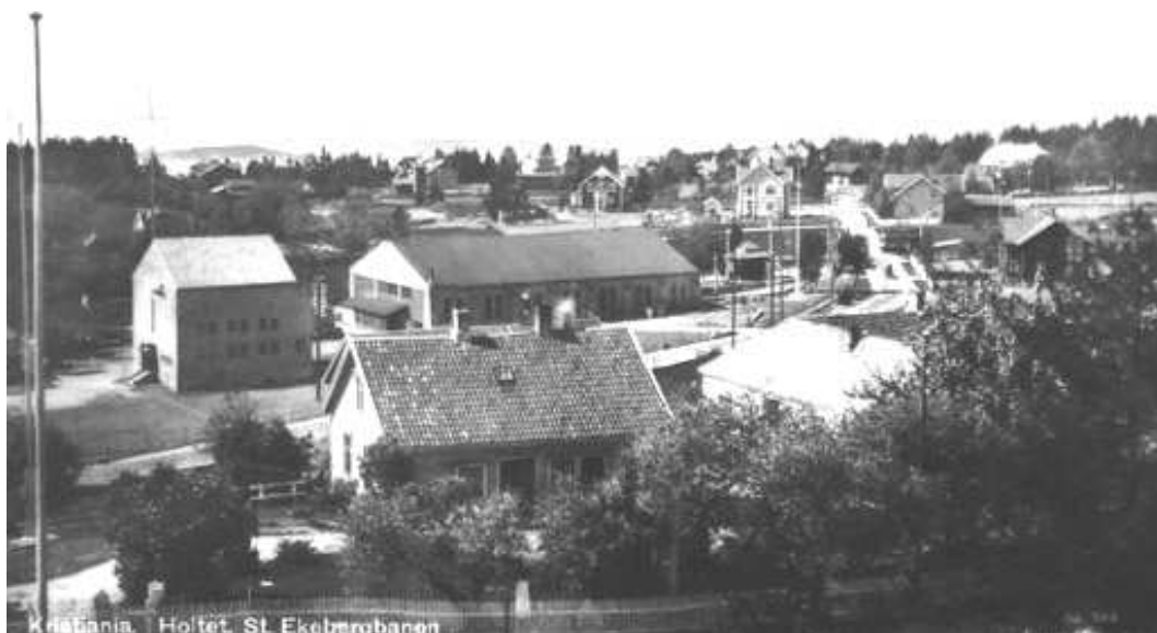
Området ved Holtet med våningshuset på Bernhus i forgrunnen

Senere ble et område av Traverbanen på 21 mål kjøpt av Ekebergbanen. Den ble åpnet i 1917. Hovedstasjon med trikkestaller, verksted og transformatorstasjon ble lagt til Holtet. Sporveien driver fortsatt vedlikehold på trikkene og har sin baneavdeling her.