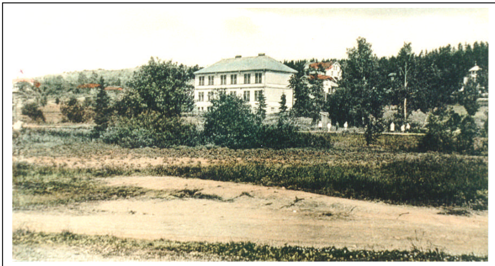
Fra "Travbanen" mot skolen.

Aker Kommune tillot at Den Norske Traverklubb avholdt kappkjøring på veien over Ekebergsletta i 1879. Eller som teksten lød: "Afholdelse av en kappkjøring med hjulredskaper". Det ble tilføyet at veien for fremtiden ikke kunne avgis til dette bruk. Dette kan være noe av grunnen til en senere plan om travbane i området.