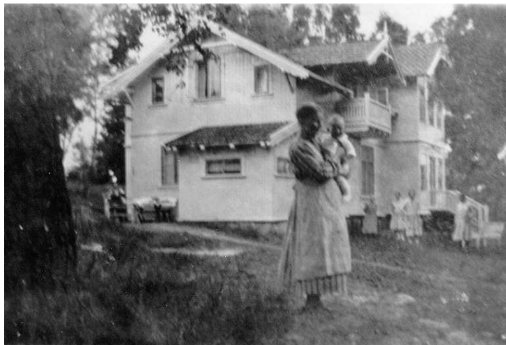
Bilde av Birkelund, huset ligger her fortsatt

Denne artikkelen er utdrag fra boka Fra gård til villa , samt en del ny informasjon som er gravet frem av BLF: Utsikten var tidligere en husmannsplass under Nordseter. På eldre kart fra 1844 var navnet Knutsbråten avmerket, på nyere kart står det Utsikten. Navnet Bråten, Utsikten og kun Nordseter eie brukes også sammen med navnet Knutsbråten i ulike folketellinger i første