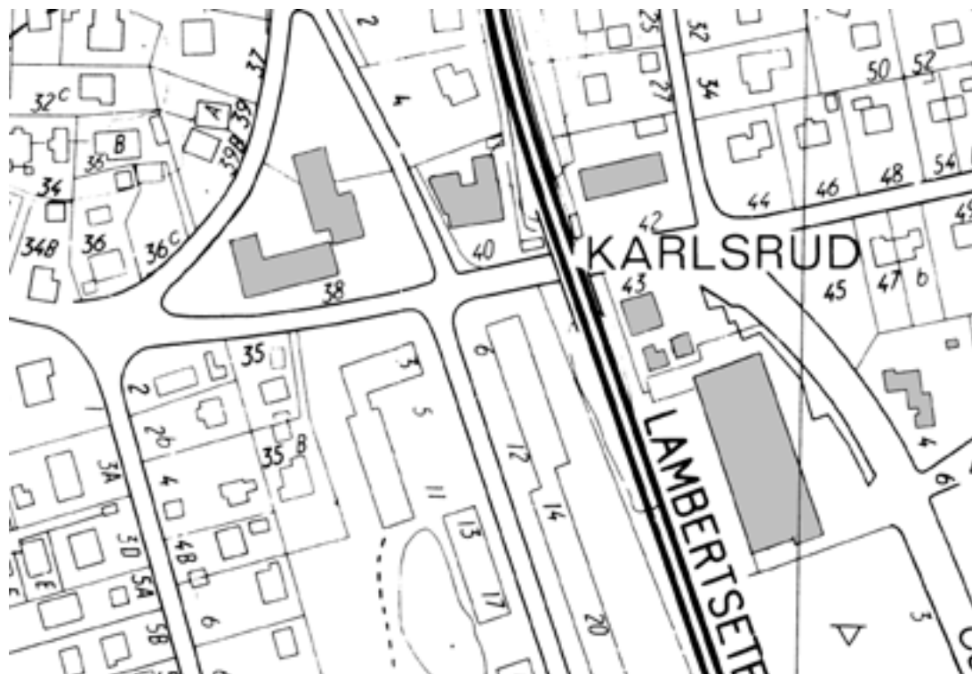
8C. Detaljkart over Karlsrud i moderne tid