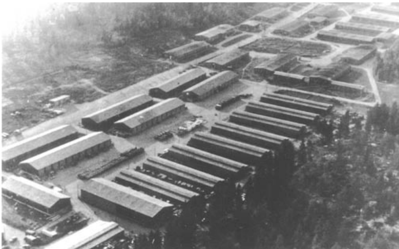
7. Lager Nordstrand - militærleiren på Lambertseter under 2. verdenskrig (eller rett etter)