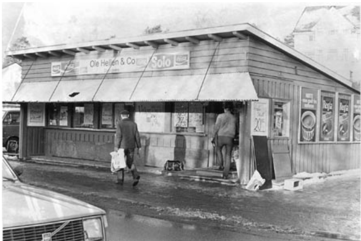
10B. Ola-bua, slik den så ut da den var butikk