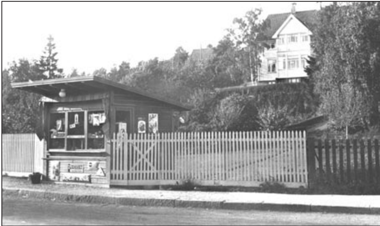
10. Ola-bua, slik den så ut før den ble butikk