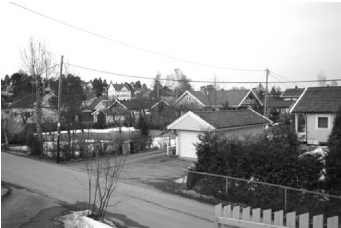
5B. Det går fortsatt an å kjenne seg igjen etter ca. 90 års tid