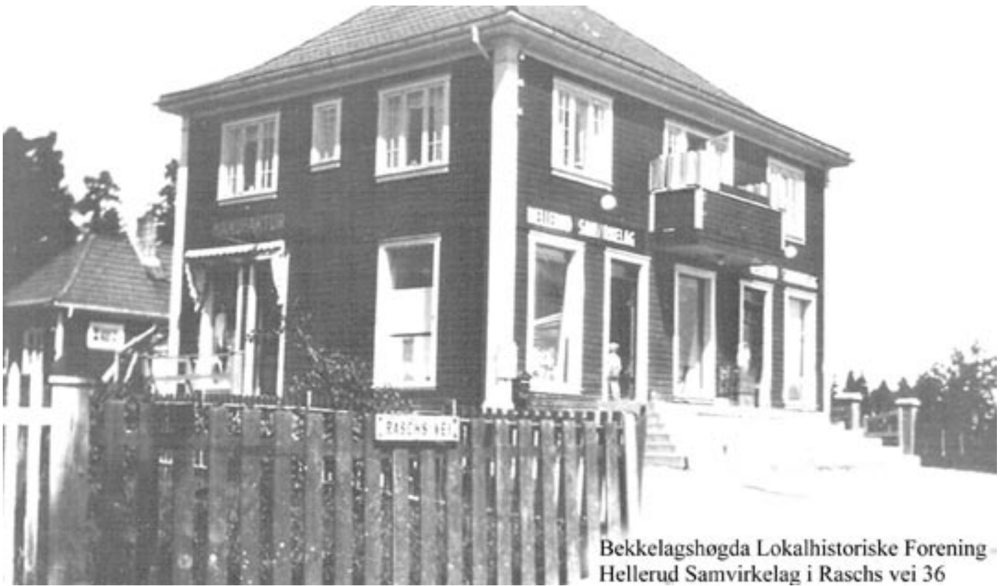
Bekkelagshøgda Lokalhistoriske Forening Hellerud Samvirkelag i Raschs vei 36

9. Hellerud samvirkelag var det første samvirkelaget på Karlsrud