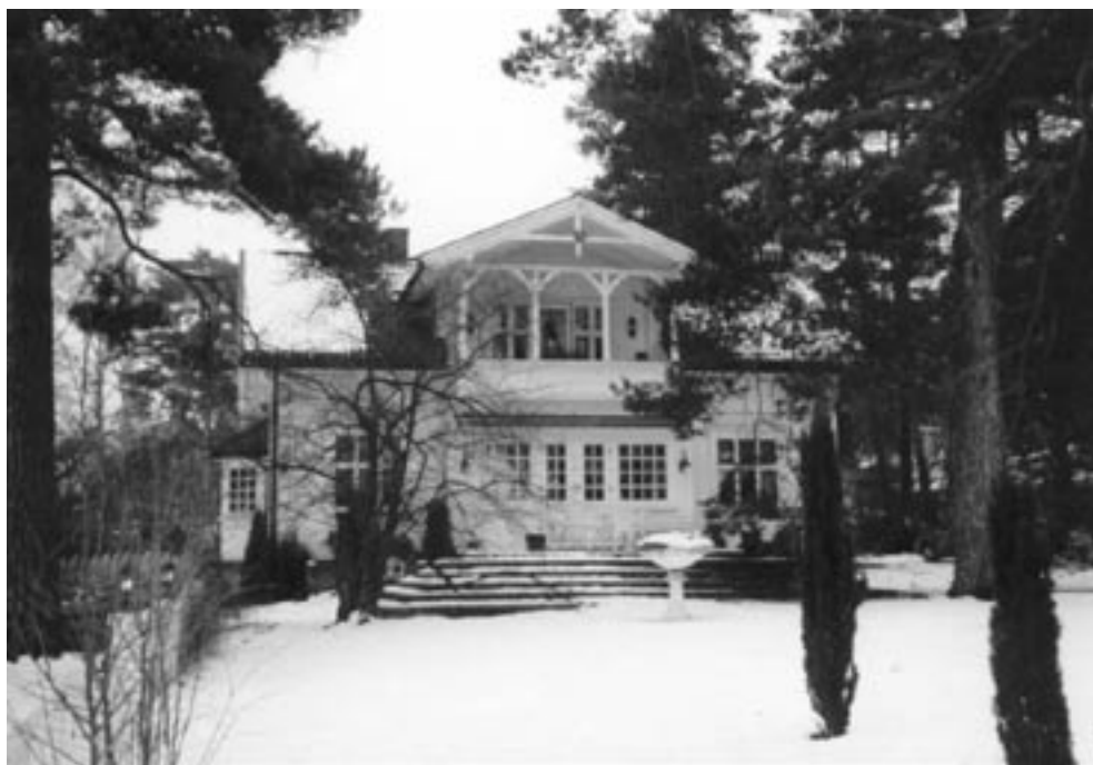
2. I Granstuveien ligger fortsatt denne gamle villaen, men naboene er kommet nærmere enn her.