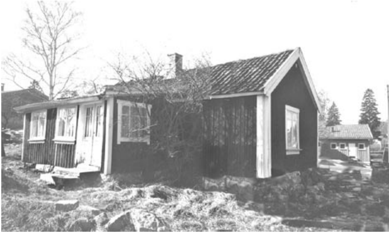
4. Plassen Ringshus under Hellerud ga navnet til Ringshusstubben (og Ringshusveien)