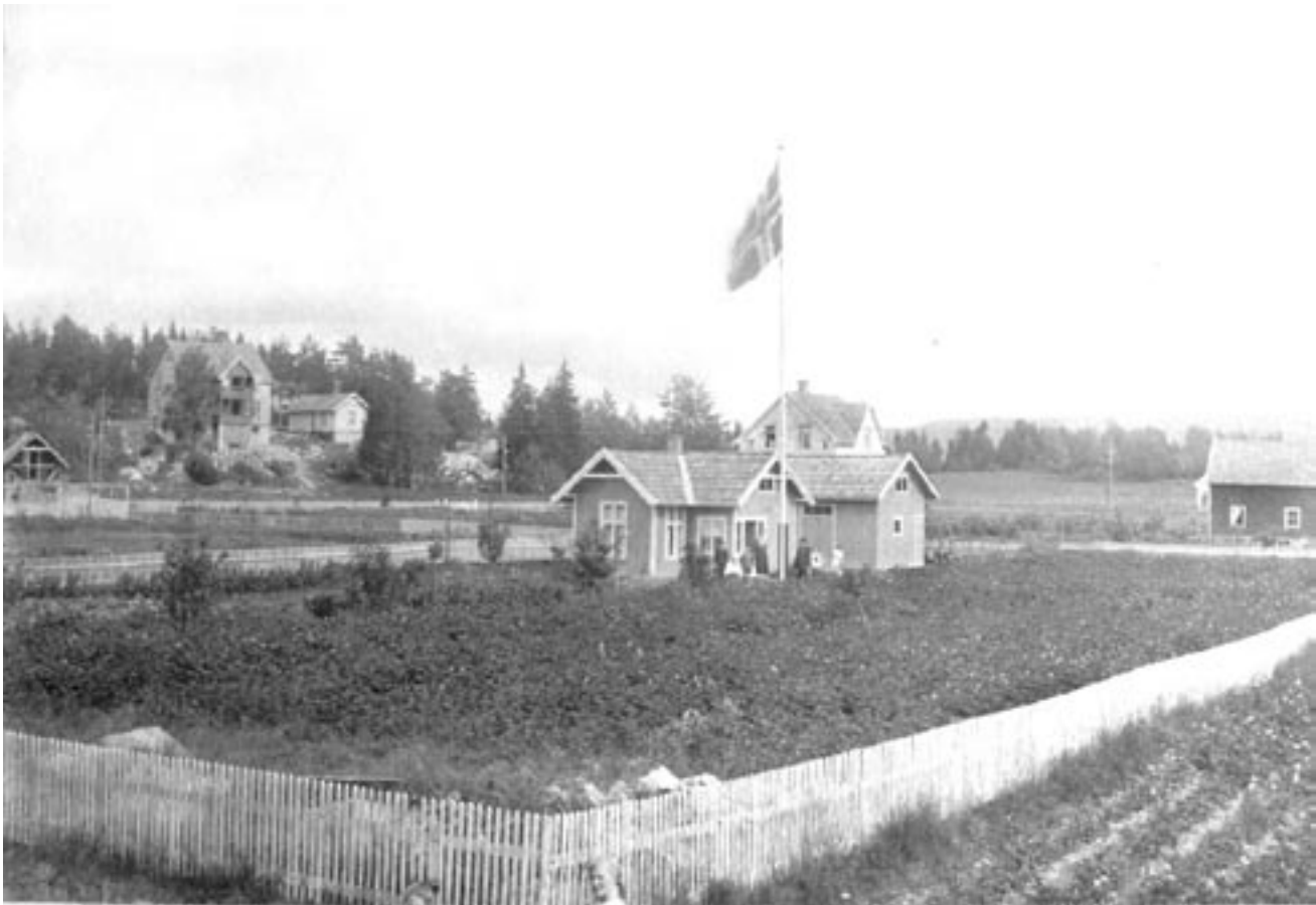
5. Fra Bernt Knudsens vei, utsikt mot Karlsrud