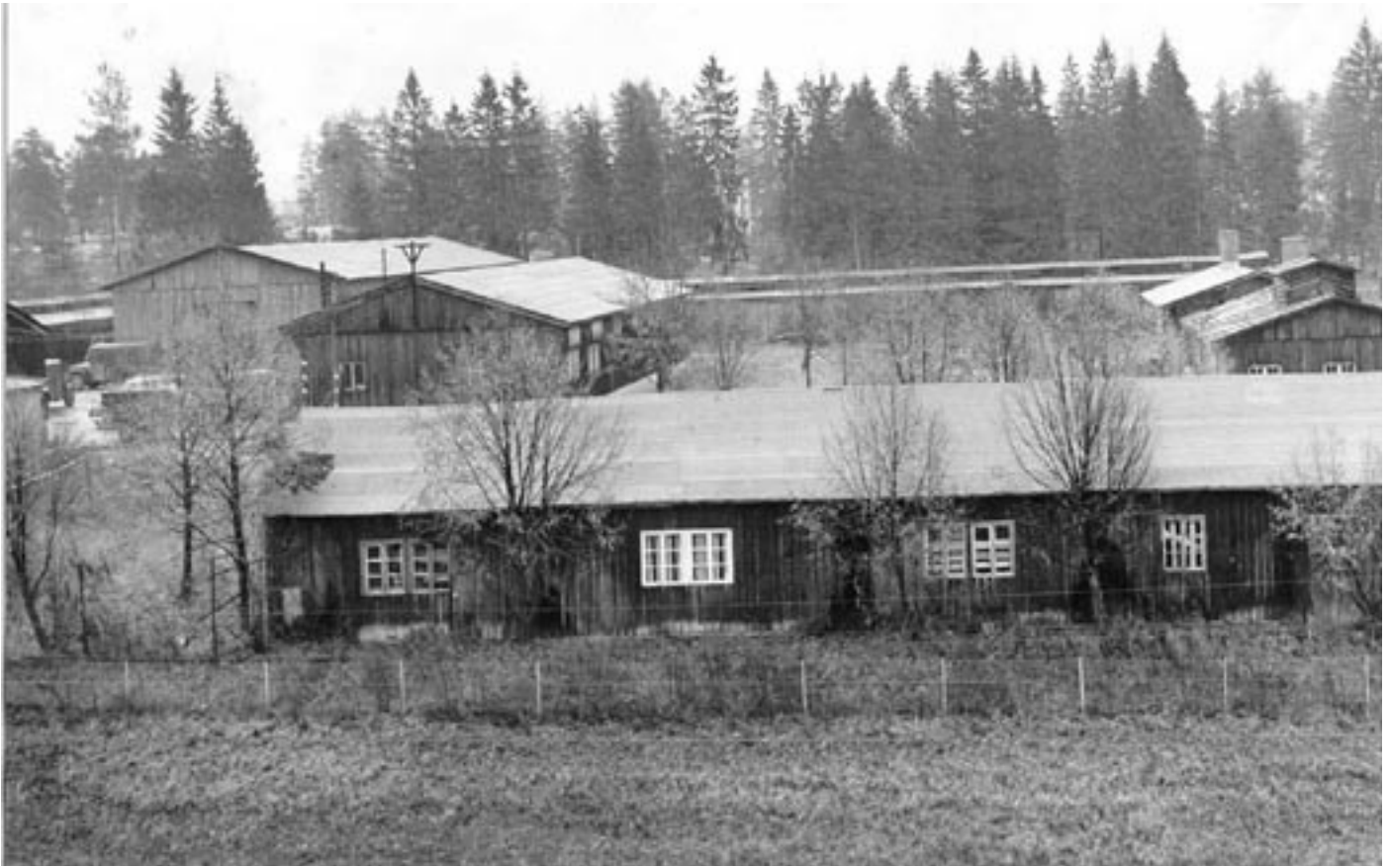
7D. Militærleiren på Lambertseter ble benyttet til sivilt formål til godt utpå 1950-tallet