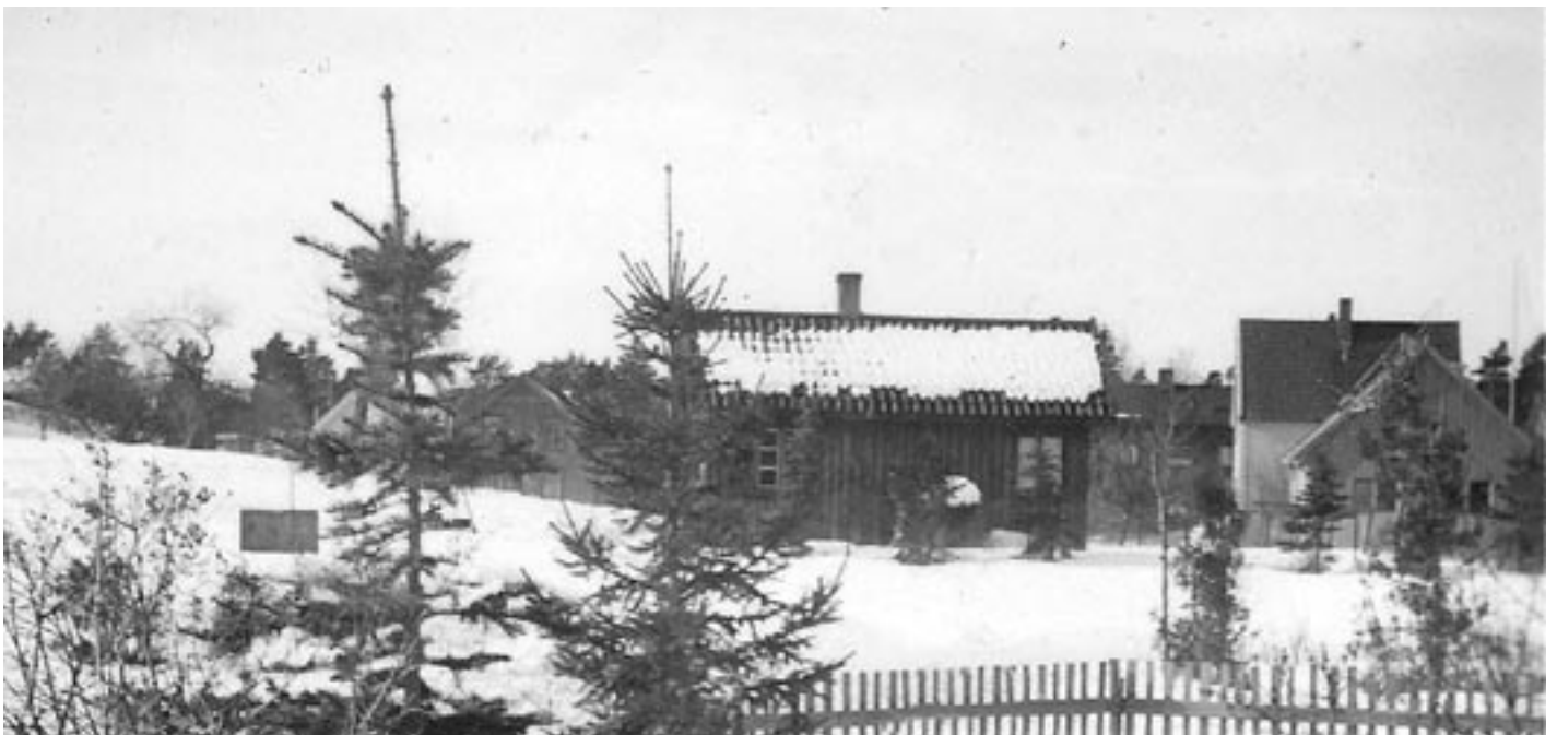
8. Plassen Kolsrud hørte til Lambertseter. Husene i bakgrunnen ligger til Oberst Rodes vei fortsatt.