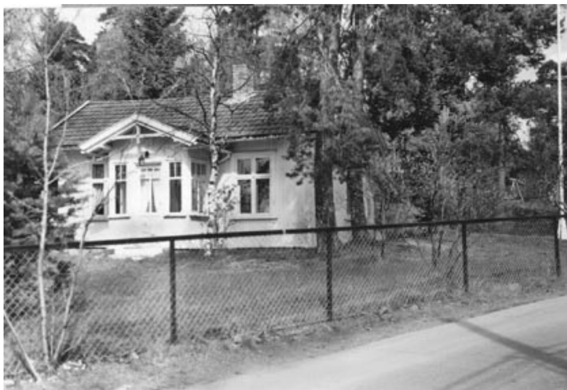
3. «Hygga» lå i Hyggeveien som selsagt er oppkalt etter huset