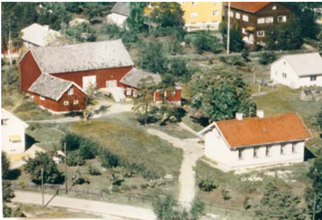
6. Gården Nordre Hellerud