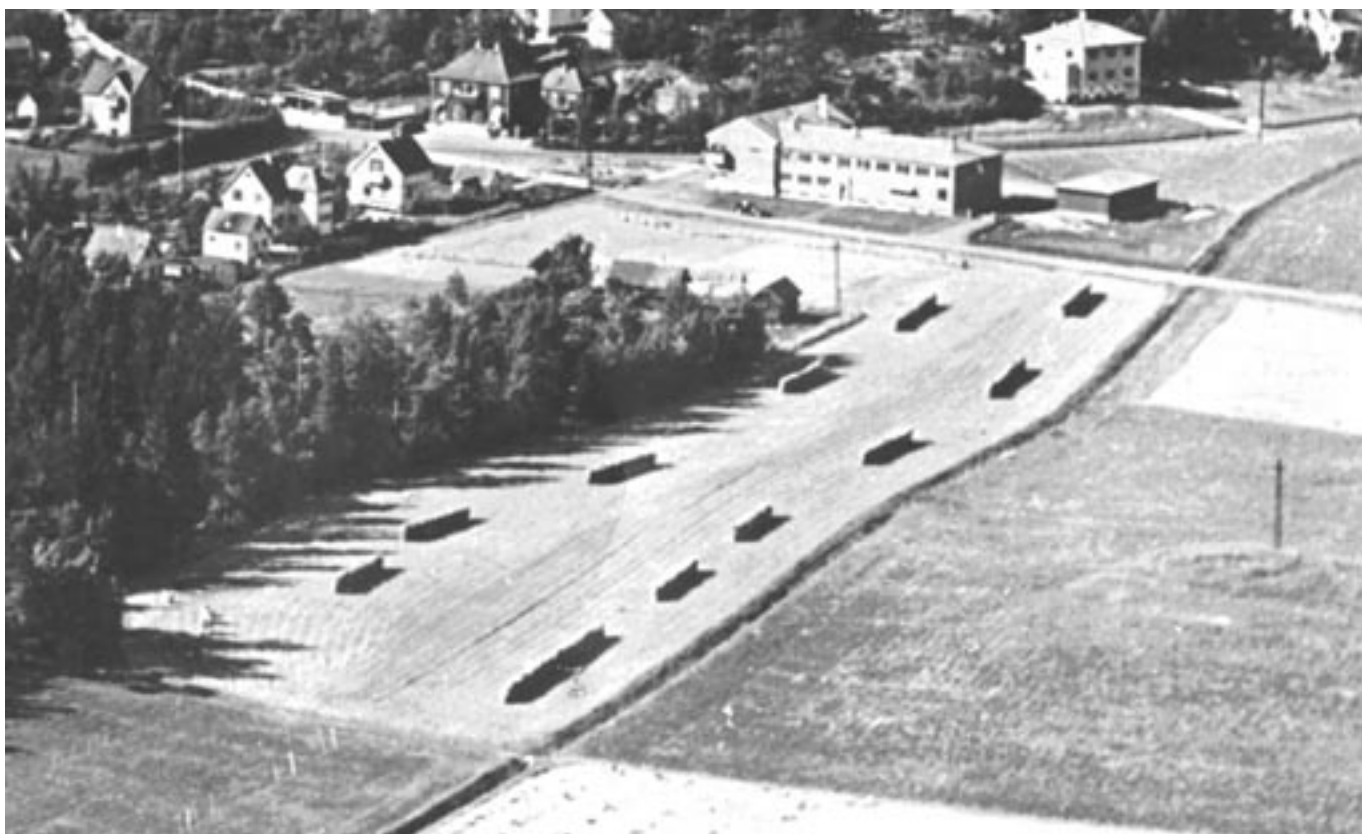
7B. Kolsrud husmannsplass under Lambertseter og bebyggelsen på Karlsrud før 2. verdenskrig