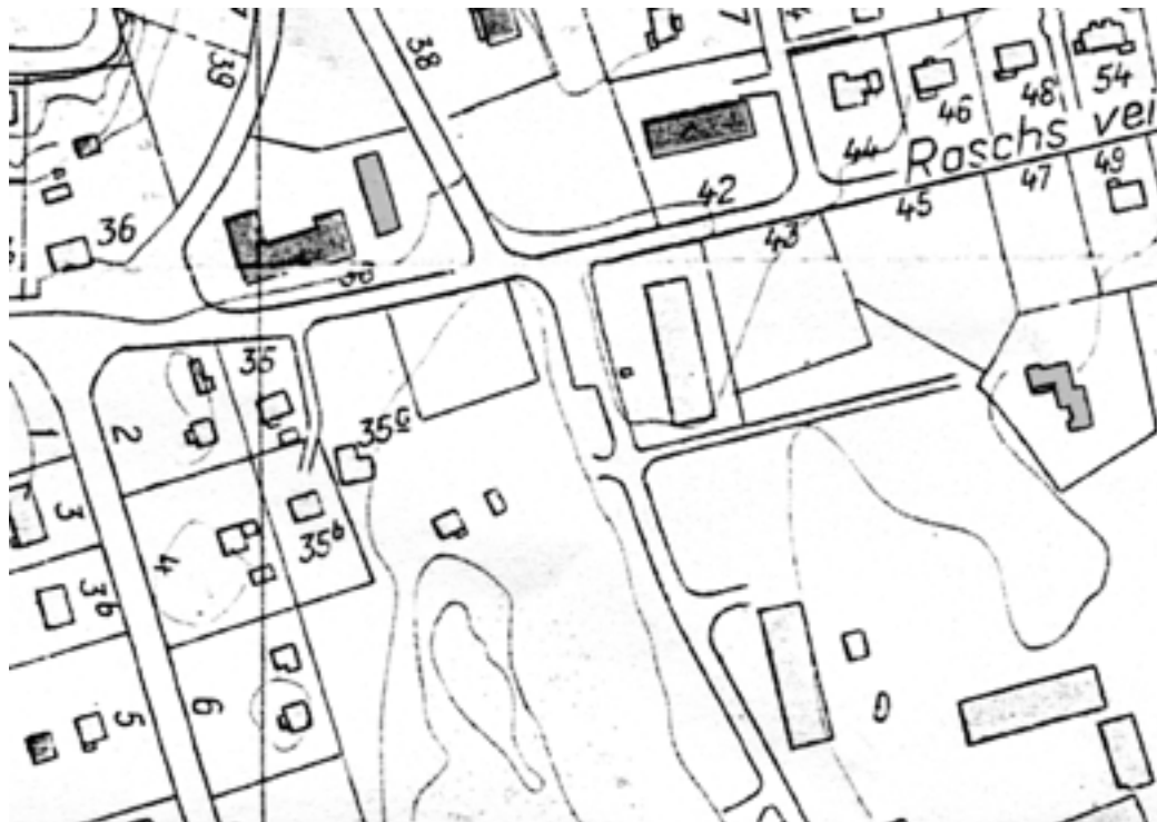
8B. Detaljkart over Karlsrud i i tiden rett etter 2. verdenskrig